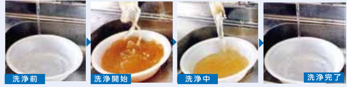
上の写真は実際にアクシルを使用した際の水道水の変化と、水道管そのものの汚れを落とした写真です。

一般的に水道管は住宅設備の動脈と言われています。水道管の破損や詰まりを起こすと建物を建て直す程の大掛かりな工事につながってしまいます。